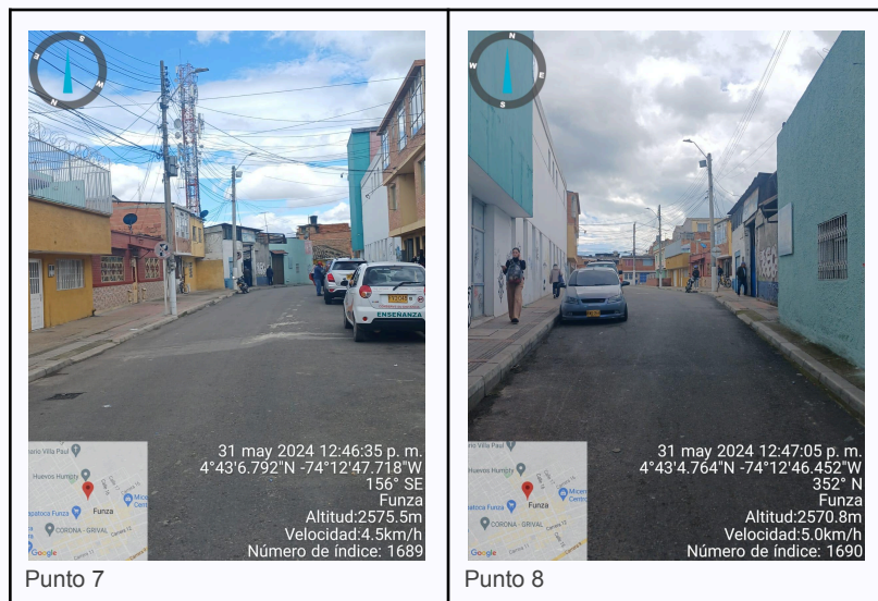
Ilustración 2. Fotos de los puntos del Recorrido de Control Y Vigilancia.