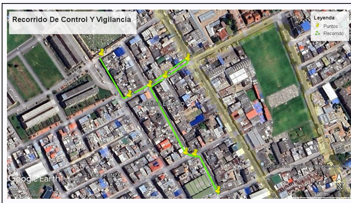
Ilustración 1. Recorrido de Control Y Vigilancia N°12

Se realizó recorrido de control y vigilancia en el cuadrante 3, barrio El Lago el día 31 de mayo del 2024, desde las coordenadas 4°43'12.24"N- 74°12'52.8" W hasta las coordenadas 4°43'4.764" N- 74°12'46.452 "W (ver ilustración 1. Ruta amarilla), con el fin de verificar las condiciones ambientales, identificar posibles afectaciones a los recursos naturales y realizar las acciones de prevención correspondientes.